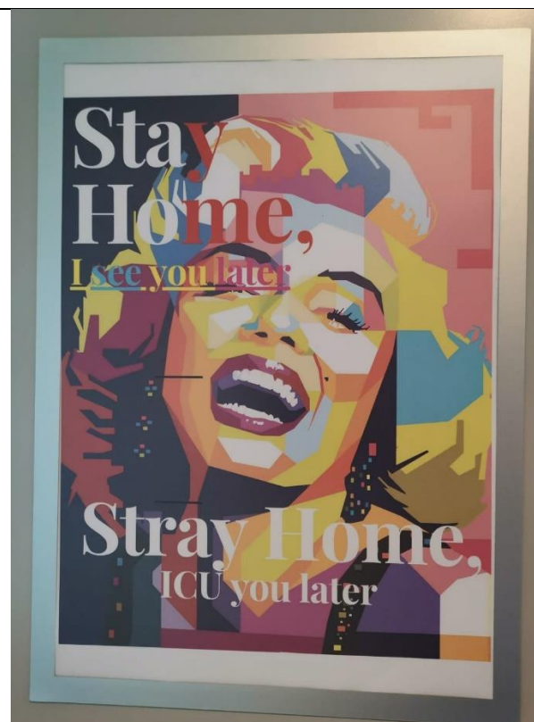
Poster yang mengingatkan orang ramai supaya duduk di rumah